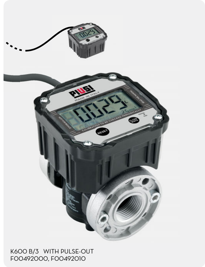
K600 B/3 WITH PULSE-OUT FOO492000, FOO492010