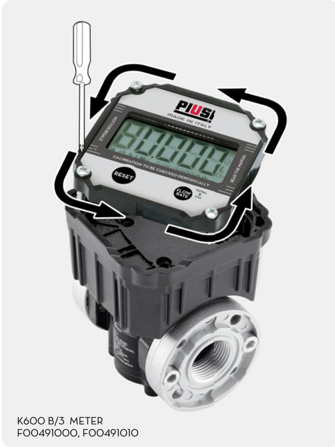
K600 B/3 METER FOO491000, FOO491010