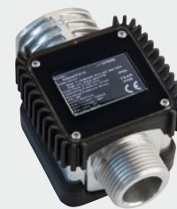
K24 (not for oil)